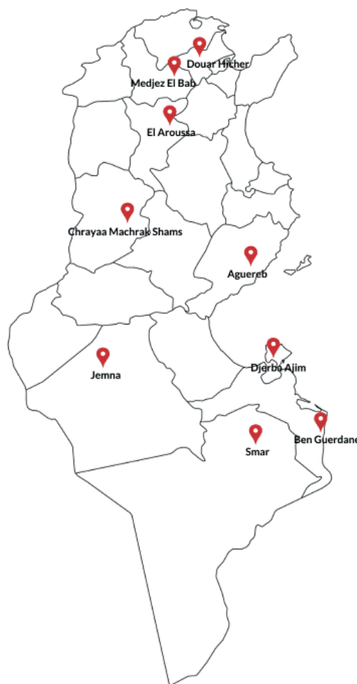
Figure 1 : Localisation des neuf communes partenaires sur la carte de la Tunisie

D'autres entités à l'échelle locale et régionale, concernées par la question de la jeunesse, sont touchées par l'intervention du projet Fe3il.a telles que, les directions et les commissariats régionaux chargés de la jeunesse et des sports, de la formation professionnelle et de l'emploi, de la culture, de la santé, des affaires sociales... et des différentes structures locales telles que les maisons de jeunes, les maisons de culture, les centres d'accueil et de tourisme des jeunes, les centres de médecine scolaire et universitaire, les centres de défense et d'intégration sociale.