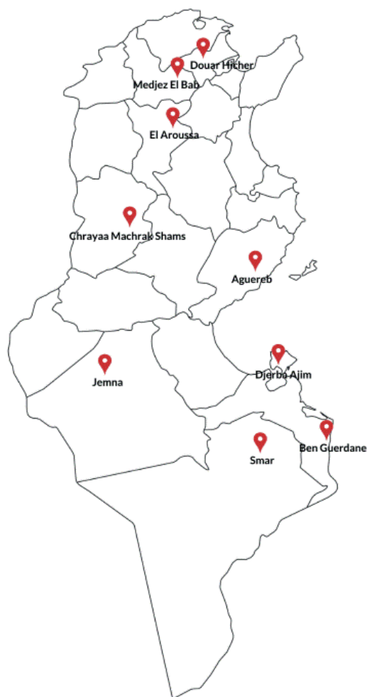
Figure 1 : Localisation des neuf communes partenaires sur la carte de la Tunisie

D'autres entités à l'échelle locale et régionale, concernées par la question de la jeunesse, sont touchées par l'intervention du projet Fe3il.a telles que, les directions et les commissariats régionaux chargés de la jeunesse et des sports, de la formation professionnelle et de l'emploi, de la culture, de la santé, des affaires sociales... et des différentes structures locales telles que les maisons de jeunes, les maisons de culture, les centres d'accueil et de tourisme des jeunes, les centres de médecine scolaire et universitaire, les centres de défense et d'intégration sociale.