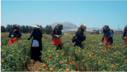
CHAMPS DE CARTHAGE - à Ben Sâlim

Par L'Economiste Maghrébin - 9 juin 2020