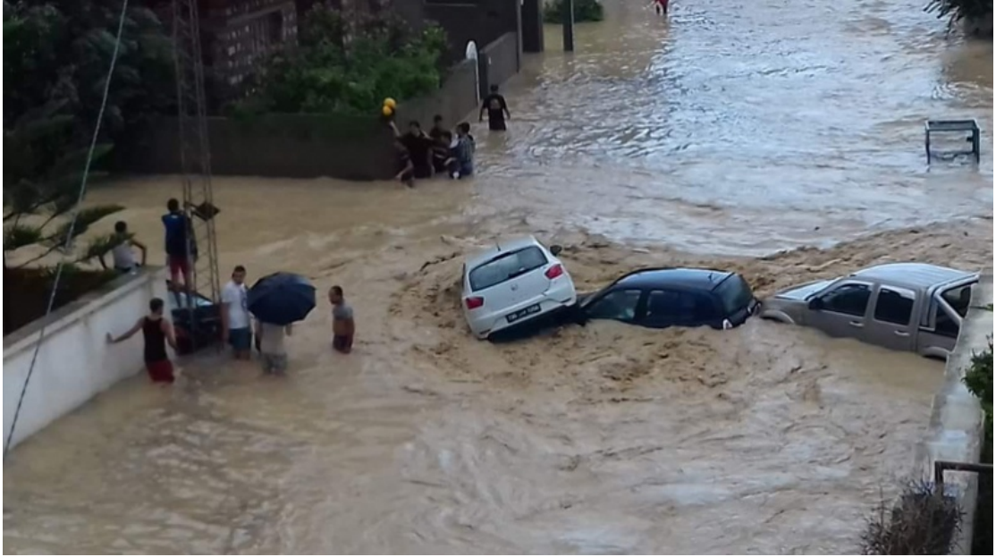
صورة من فيضانات التي اجتاحت منطقة رّواد

➤ تأخير و تعطيل في إنجاز مشاريع تصريف مياه الأمطار ممّا ضاعف في حدّة الانعكاسات السلبية تبلغ أحيانا حدّ الكارثية التي تخلفها الفيضانات الخطيرة والمتكرّرة التي تعيشها بلدية رّواد إذ أصبحت مصدر أرق مواطنيها في عيشتهم و تمثّل من أشدّ هواجس و مخاوف متساكنيها جميعا.